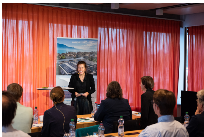
La conseillère nationale Brenda Tuosto souligne la pertinence de Cité de l'énergie pour avancer.