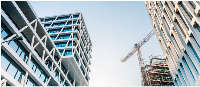
Einer der vier Themenschwerpunkte der IEU Kommunikation AG: Bau und Immobilien