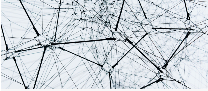
Einer der vier Themenschwerpunkte der IEU Kommunikation AG: Digitalisierung und Innovation