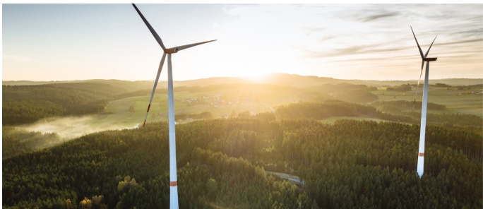
Einer der vier Themenschwerpunkte der IEU Kommunikation AG: Energie und Klima