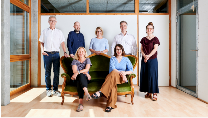
Teambild der IEU Kommunikation AG