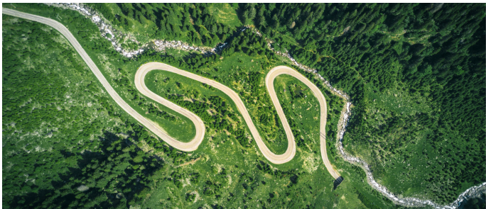
Einer der vier Themenschwerpunkte der IEU Kommunikation AG: Nachhaltigkeit und Transformation